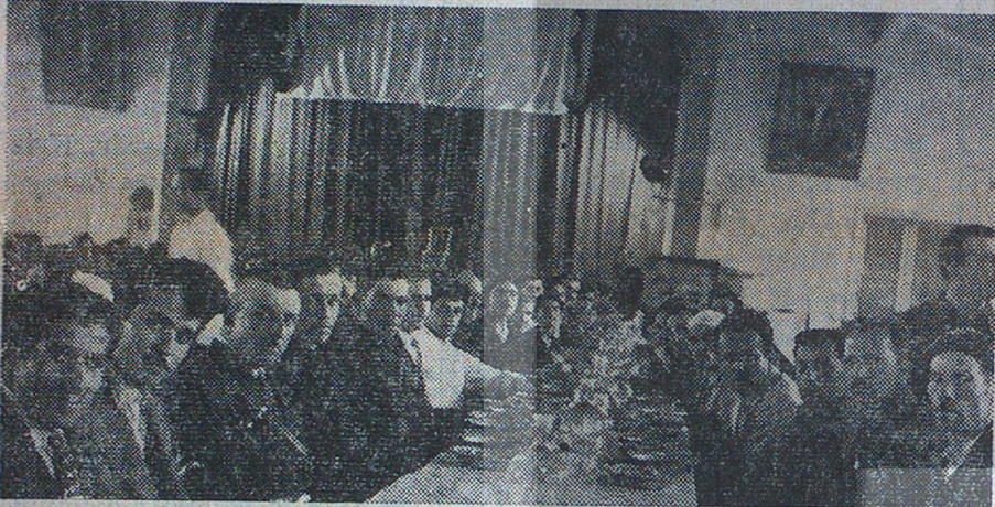
Bakırköy Beş Fabrikası İşçi yemekhanesinde öğle yemeği

Bu istidadı gösterenlere sorarsınız. «Biz muamele vergisinin ağırlığından ötürü mallarımıza bir miktar zam yaptık. Bu zamla artan kumaş fiyatının yüksekliliğini ileri süren tüccar bizden mal satın almak istemiyor» Diyorlar. İşçi; bu fikrin tamamen aksini iddia ve ispat ediyor. Şöyle ki: «Evvelden, yani harp yılları ve sonrası içinde patron satışa arzettiği; yani tüccara verdiği malı, sağlam iplikten yapıyor buna mukabil de fahiş deneyecek bir kâr temin ediyordu. Halbuki bugün çok kazanmak sevdiğine tutulan patron çok kötü ipliklerle kumaş dokuyor ve aynı kârı elde etmek istiyor. Şiş hesiz ele alnamıyacak kadar kötü olan bir kumaş hiç kimse almaz ve giymez bundan ötürü de imâl edilen mal stok olarak ya-